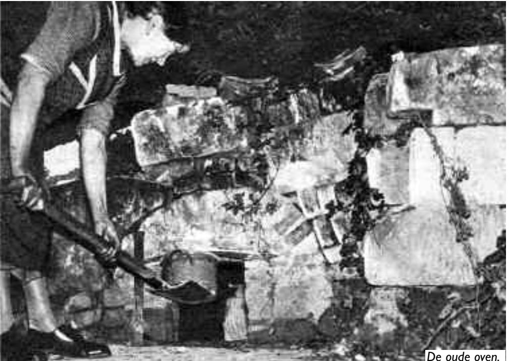
De oude oven.

Een andere bron van inkomsten was de ontvangst van toeristen in haar grotwoning. Er werd wel bij het verlaten een vrijwillige bijdrage verwacht. Als bezoekers te weinig gaven werden