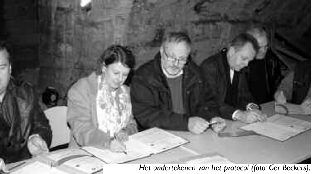
Het ondertekenen van het protocol.

verscheidene groeven in Belgisch Limburg onder haar hoede heeft, wil de natuur- én cultuurhistorische waarden van de mergelgroeven uiteraard maximaal behouden en verder ontwikkelen en is dan ook bijzonder verheugd met dit protocol.